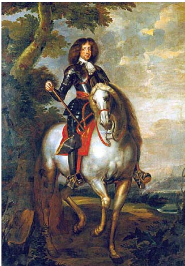
Christian V. Efter målning av Abraham Wuchters.

Den 27 oktober 1676 tågade en dansk armé på 13.000 soldater från Kvidingehållet söderut genom Röstånga, och sen vidare mot Näs vid Saxån. Kung Christian V var fast besluten att återvinna sin fagraste provins, Skåne. Föga anade han då det öde, som skulle drabba hans styrka redan i början av december samma år, nere vid Lund. Som gränsland mellan Danmark och Sverige hade Skåne länge varit ett av krig svårt drabbat land. Inte förrän vid Helsingborg 1710 skulle ett sista fältslag komma att utkämpas på skånsk mark. Nedan följer en antydan om händelser som berört vårt eget närområde under "snapphanetiden", dvs. på 1600-talet .