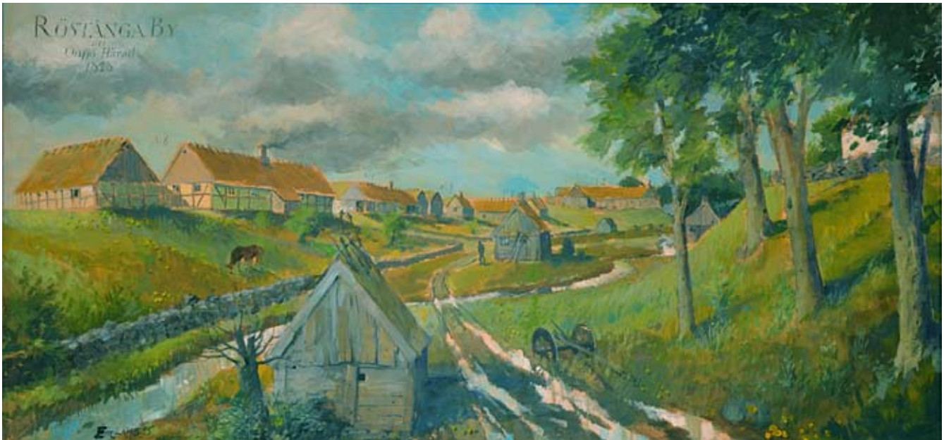
Röstånga by före enskiftets tid, här efter målning av Erik Lilius. Perspektivet är från öster. Längs bygatan ringlar Kyrkbäcken och här står hantverkarnas gatuhus, på höjdryggen till vänster ses södra raden av byns hemman,

med nr 8 närmast och Nedangården i bakgrunden. Ovan brinken till höger skymtar den vita sockenkyrkan, med anor från 1100-talet.