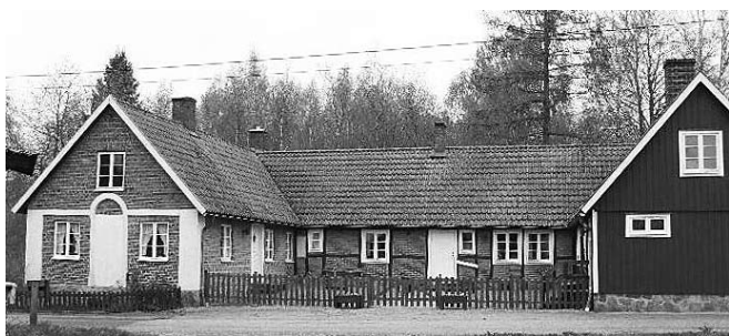
Församlingshemmet i Röstånga

stod klar för invigning den 1 november 1980. Mycket av inventarier var gåvor och medel från föreningens kassa. Svea Fors och maken Ivar skänkte den stora vackra tavlan, "Jesus måltid med lärljungarna" som Ivar Fors målat.