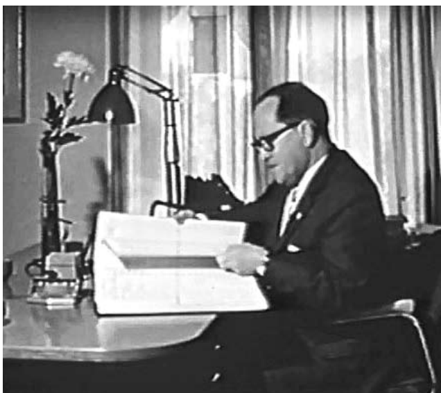
Kyrkoherden i arbete på prästgården i Billinge.