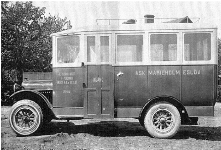
Ask-Marieholm-Eslöv startade 1922.

Bror Göransson. Bussen var av märket REO, detta enligt Åke Bergfors i Bjärsjölagård som personligen kände ägaren. REO sålde bra och 1907 var man USA:s tredje största tillverkare, efter Ford och Buick.