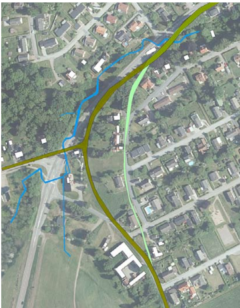
Infarten till Röstånga från Ask. 1913 fanns den bruna sträckningen som då hade avlöst den gröna. På 1940-talet hade också bäcken en helt annan riktning. Troligen nyttjade man vattenkraft vid snickeriet.