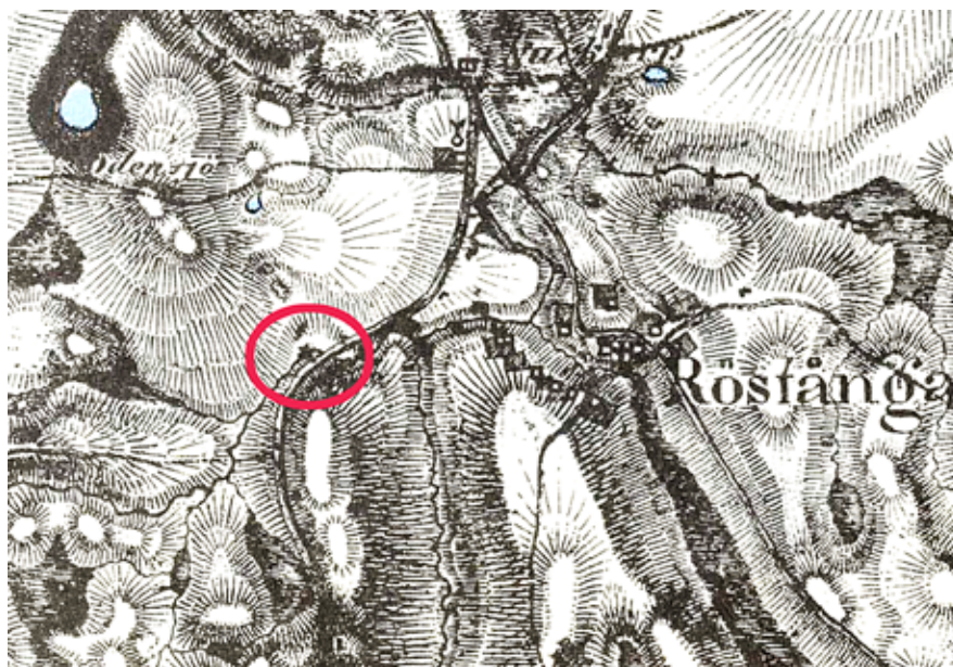
Skånska rekognosceringskartan 1812-20 med kvarnen markerad.