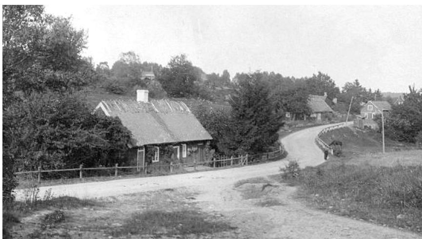
Foto taget uppe från gamla vägen över Hallaliden. Till vänster ses en dragning via dagens Västergatan.

kameror, men saluförde även mera avancerad fotoutrustning, liksom radioapparater. Luxors "Raka 4:an" var en klassiker. År 1943 köpte familjen fastigheten.