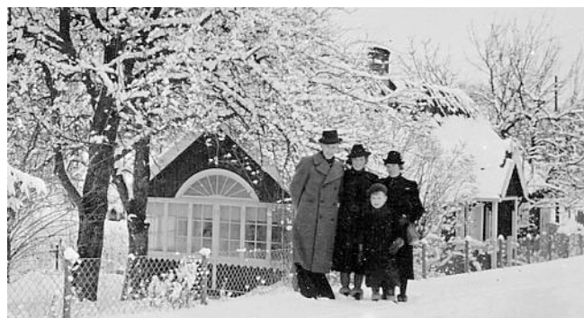
Familjen Ulriksson framför huset med den stiliga verandan.

Den gamla landsvägen från Ask ledde förr i tiden inte in i Röstånga på samma vis som idag. Den kom sydvästifrån, via gården Duvskog. Där sneddade den över nuvarande väg 108 och gick sen på andra sidan in i byn uppe vid Västergård. Därefter gjorde den en mjuk sväng nerför Hallaliden och landade i dalgången med Blinkarpsbäcken. Först efter korsningen vid Backavägen gled den slutligen från sydsidan in där dagens breda stråk 108 går fram som Marieholmsvägen.