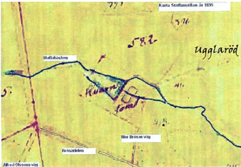
Och här en mycket gammal karta

Vi begav oss upp i skogen och till det lilla som finns kvar att beskåda. Med ledtråd av ruinen gjorde Eric en perfekt teckning över hur kvarnen troligen såg ut på 1800-talet.