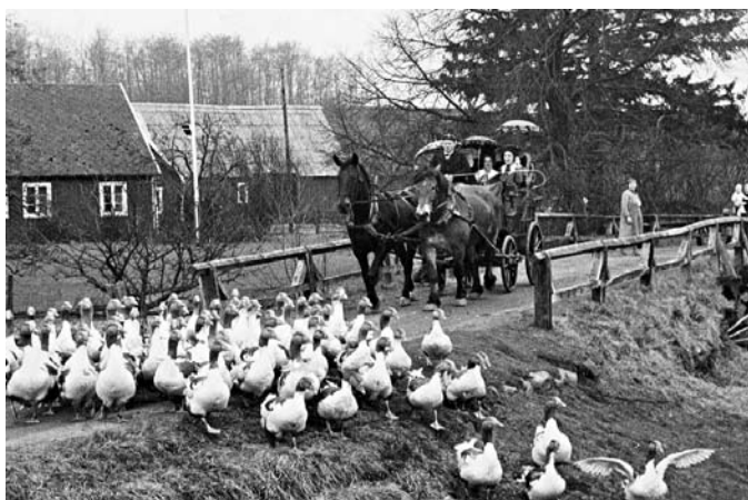
Postdiligensen från Röstånga passerar Hissbro. Rekonstruktion vid insamling "Flyktning 67" i Billinge

Onsjöbygden, 2003. Senare på 1700-talet satte man mellan dessa milstenar stenar även upp halvmils- och kvartsmilsstolpar.