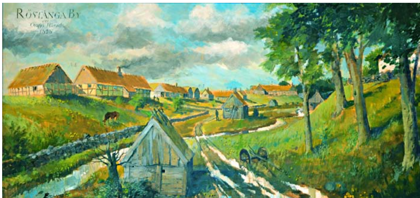
Röstånga gamla by år 1808. Rekonstruktion av Eric Lilius.

Stenen nere vid Midgård står ju också betydligt närmare gamla bygdevägen nr 4, där denna från Billingehållet i äldre tid ledde in på bygatan söder om kyrkan längs Kyrkbäcken, och därefter korsade denna. På kartbladet