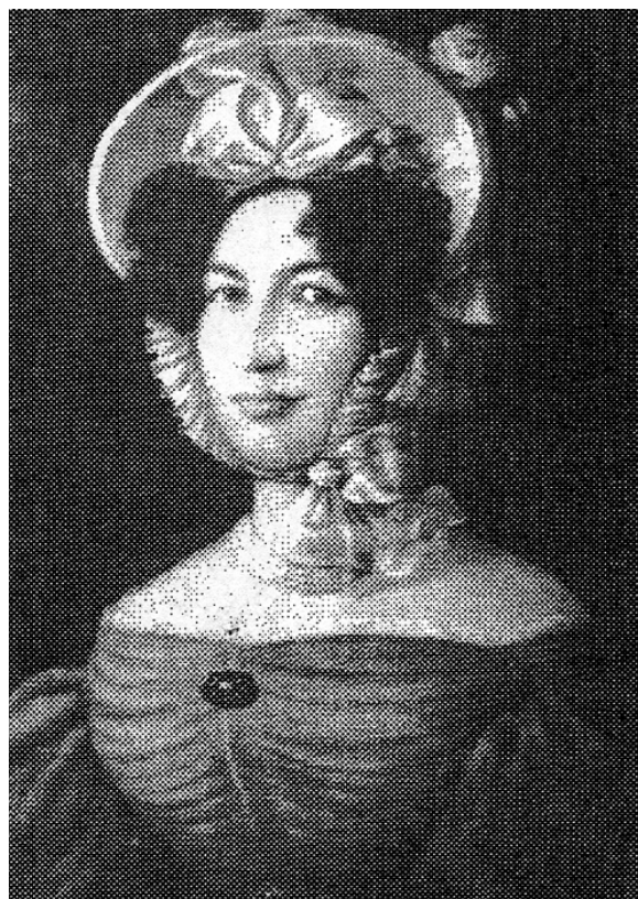
Efter gravyr av G Lillevall.

Kronoskatterusthållet Duveskog i Röstänga socken hade på den tiden sitt boställe endast ca 650 m rakt väster om Stora Tibbaröd, där den gamla häradsvägen från Billinge ledde fram över Bäljane å. Enligt kartan 1812 låg manbyggnaden på gårdsplatsen i öster, med långsträckt flyglar i norr och söder, följda av var sina "vakthåll" längst mot väster. Fram till år 1814 residerade majoren och riddaren Wilhelm Königsfeldt på Duveskog. Då köper