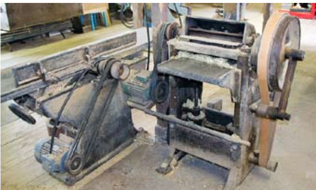
Rikthyvel och planhyvel.

gar. Här var det tätvuxen fur som gällde. Nya köksinredningar var en annan, livligt efterfrågad produkt. Sommartid tog man även ut och hjälpte folk med att klä om sina husfasader med s k CiDi-plattor, ett slags eternit. Snickeri-maskinerna var inte av det modernaste slaget, men man hade rikthyvel, planhyvel, fräsmaskin och en liten svarv.