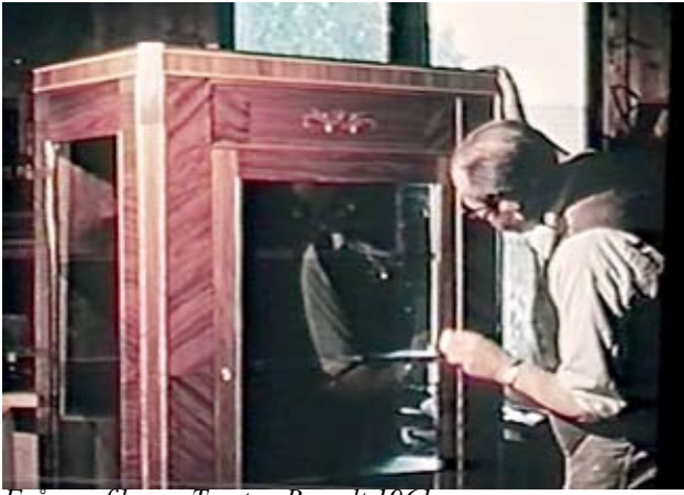
Från en film av Torsten Brandt 1961

gar. Här var det tätvuxen fur som gällde. Nya köksinredningar var en annan, livligt efterfrågad produkt. Sommartid tog man även ut och hjälpte folk med att klä om sina husfasader med s k CiDi-plattor, ett slags eternit. Snickeri-maskinerna var inte av det modernaste slaget, men man hade rikthyvel, planhyvel, fräsmaskin och en liten svarv.