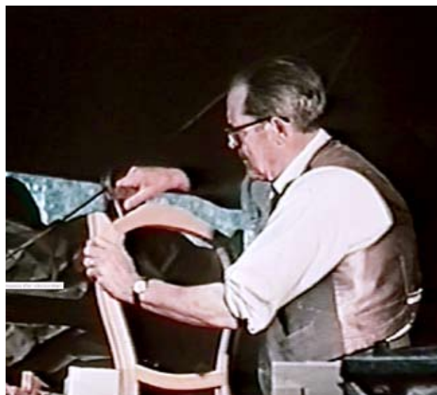
Från en film av Torsten Brandt 1961

Mera som en hobby snidade han även djurskulpturer, jag minns än han utsökta "flamingo".