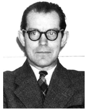
Bild från Asks sista fullmäktigemöte 1951.