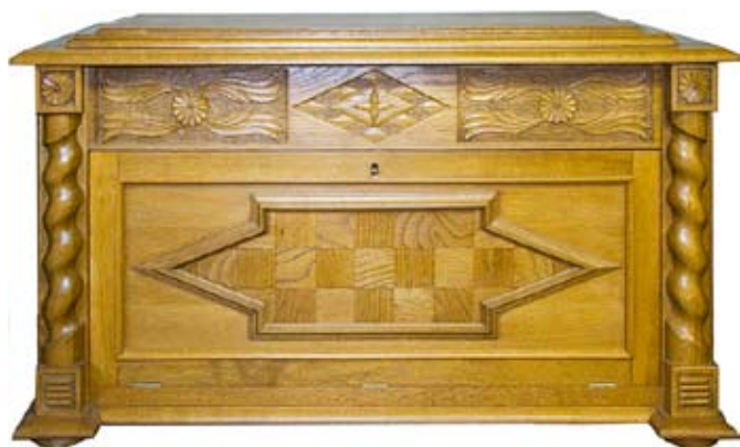
Kista i redaktörens ägo, skapad 1965.