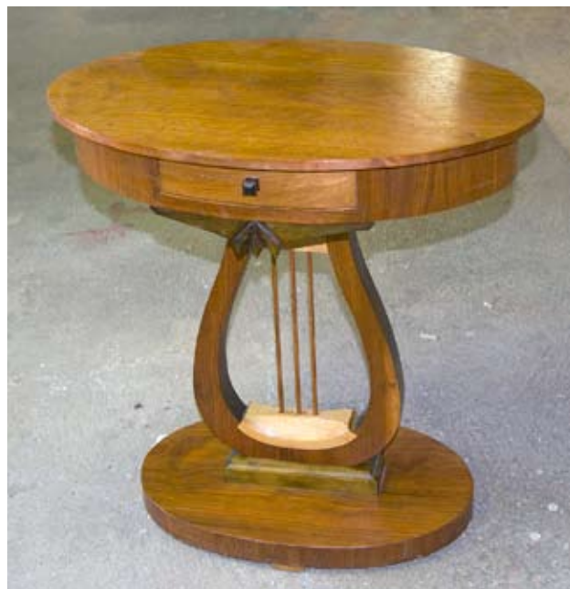
"Lyran", en populär möbel som finns i många hem i trakten.