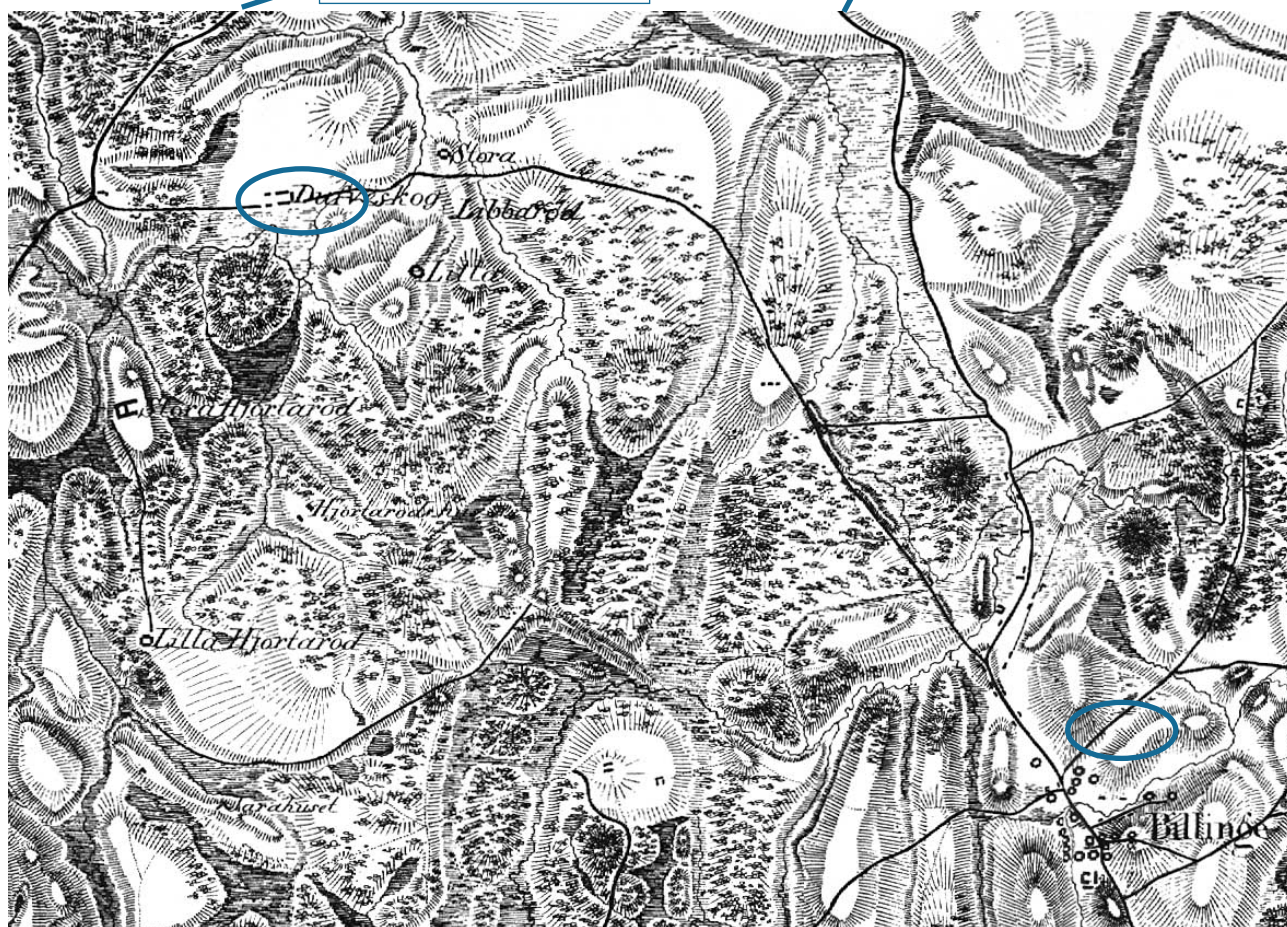
Utdrag ur Rekognosceringskartan 1815. Obs direkta vägen mellan Dufveskog och Billinge. Märk även Dufveskogs markanta byggnader. Borta sen länge. På den vackra platsen ligger nu ett fallfärdigt egna hem.

Denna väg motsvarar dagens Väg 13 från Röstänga mot Billinge -Höör