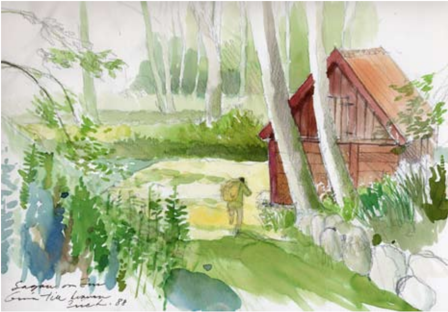
Stora Tibbaröds kvarn. Akvarell av Eric Lilius

växer rikligt med alar på sina "socklar". In- till vattenfåran och längre upp finns mängder med lerskifferkakor som på sina ställen helt täcker marken. Här sjunger också en rad typiska vårfåglar, gransångare, lövsångare och grönsångare, arter man enklast skiljer åt på deras sång.