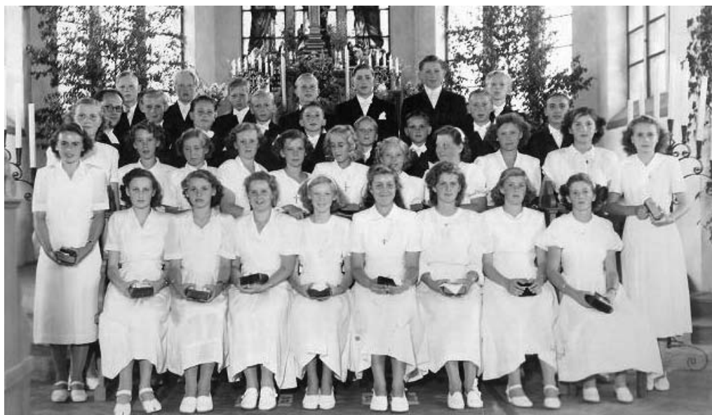
Bild tagen i Billinge kyrka den 29 juli 1949