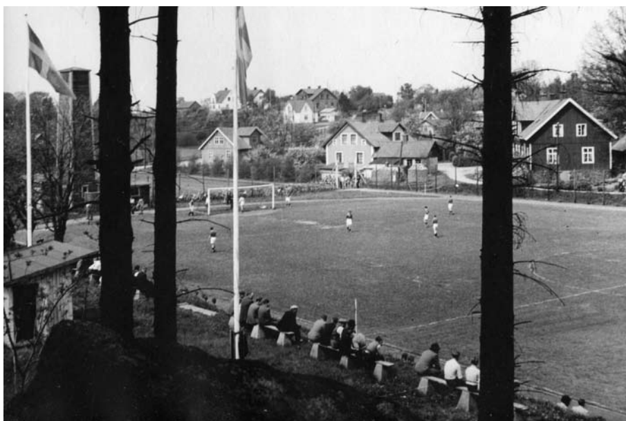
Publikmatch på gamla idrottsplatsen, "frimärket".

mofonskivor för den kvinnliga gymnastikens övningar. Vilket mötet beviljade.