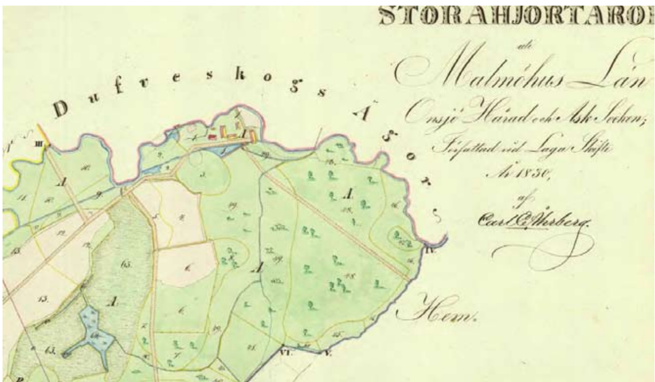
På denna karta från år 1830 syns dammen och St. Hjortaröds mölla tydligt. Gården St. Hjortaröd bestod av ett flertal byggnader.

kunde beskrivas på många sätt. Kulturhistoria som är intressant långt utanför den egna gruppen.