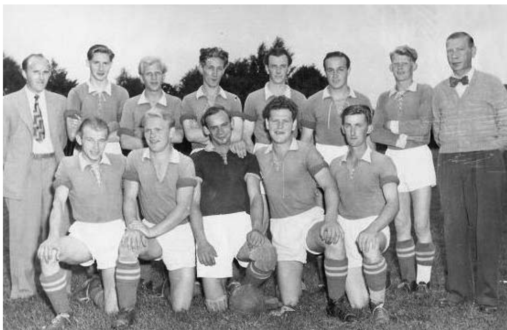
A-laget 1955, en kanske något bortglömd bild, men här är den.

Man var inte bortskämd utan för min egen del i början av min fotbollsbanan hände det att vid match i Stockamöllan eller Färingtofta då var det till att ta cykel både till matchen