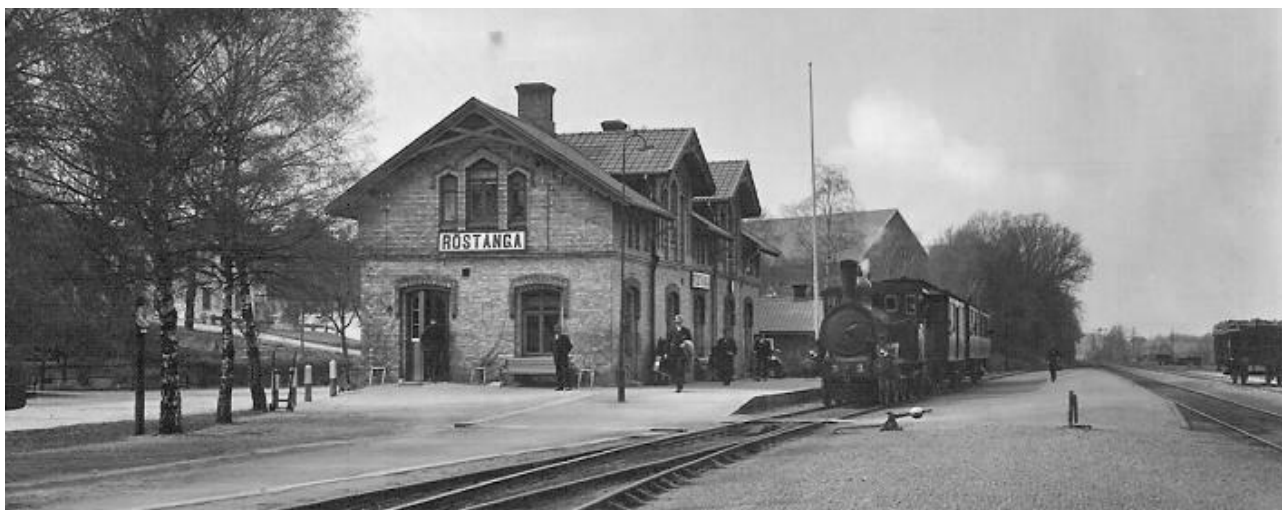
Järnvägsstationen då poststationen var på denna södra gavel.