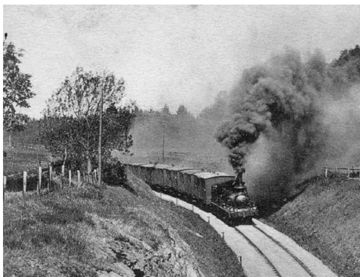
Så bär det av mot Eslöv.

d) samarbeta med kommunala organ och kulturorganisationer inom verksamhetsområdet samt ta initiativ som gynnar bygden och dess utveckling.