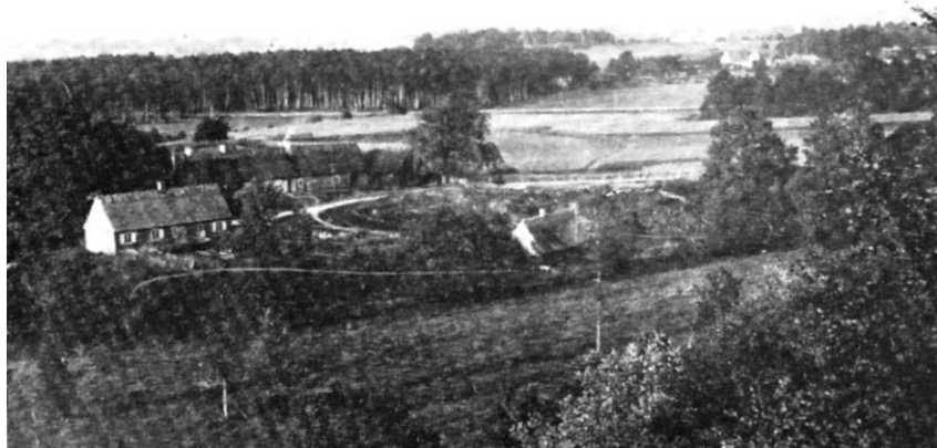
Bilden av gården, tagen av en fotograf från Landskrona 1891, vi ser undantaget t.v. samt bränneriet en bit nedanför. I bakgrunden vid trädningen ser man den anlagda banvallen till järnvägen Klippan – Röstånga som invigdes 1892.

Förklaring till överskriften är att det är det gamla Härsnäsnamnet. Redan på början av 1600-talet blev Ugglaröds gård omtalad, den hette då Ullared och där finns nog förklaringen till "Ularö". Gården hade många ägare men den mest omtalade är släkten Jonasson. Flera i den släkten var också ägare till Röstånga Gästgivaregård. I denna berättelse går vi in på 1800-talets senare del och då finner man mycket dokumentation i olika skrifter. Jag tar mej friheten att hämta från dessa och så även mitt eget forskande i denna intressanta gård. Nu kommer även dalgången att bli en stor del av innehållet i min berättelse, därför att "Ularödalen" har varit ett av mina favorit ställen och från min ungdom har jag följt både ljusa och mörka sidor i dess historia. Läsarna kan nog förstå att inslag i tidigare berättelser om Härsnäs leder till att jag har många minnen att plocka fram.